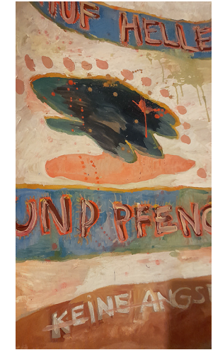
Auf Helle und Pfeng / 100x70, MT auf Pappe, 2020, VG Bildkunst, Bonn