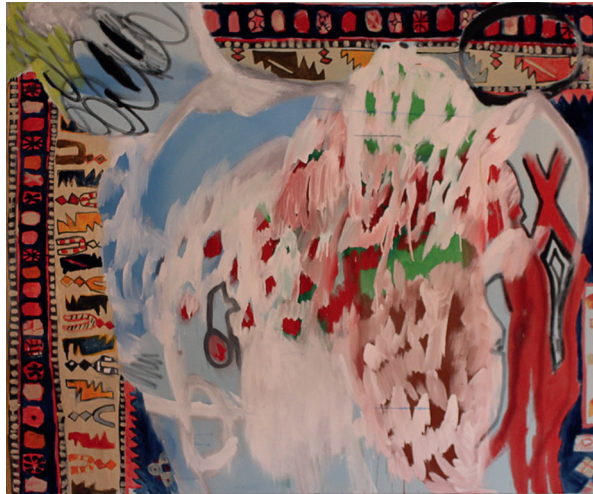
Teppichbild / 60x200, Acryl auf Köper, 2023, VG Bildkunst, Bonn