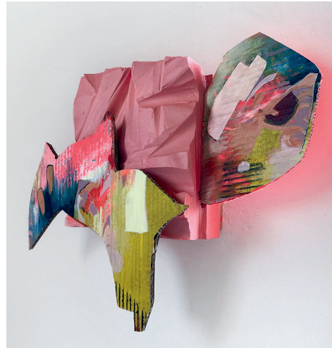
SKULPSCQUARE / 42x30, Mixed Media, 2023